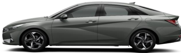
სიგრძე 4,650 საბურავებს შორის მანძილი 2,720